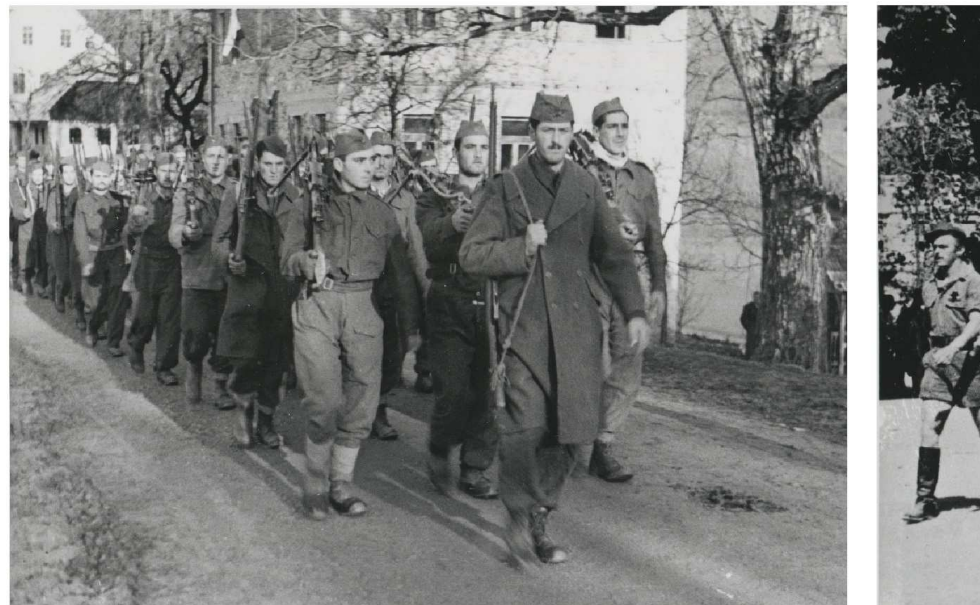
LA BRIGATA ITALIANA «FONTANOT» APPENA FORMATA IN SLOVENIA SI DIRIGE VERSO LE POSIZIONI.