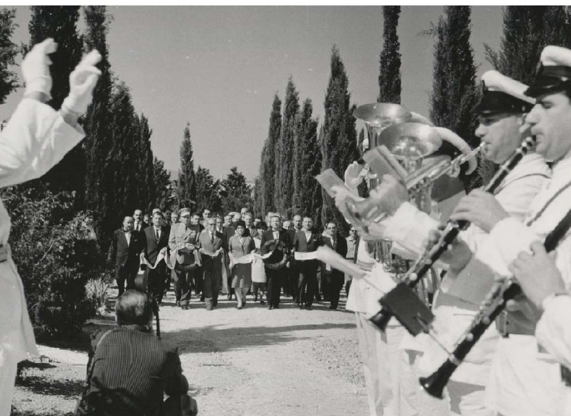
DEPOSIZIONE DI UNA CORONA NEL CIMITERO DI SPALATO DOVE SONO SEPOLTI GLI ITALIANI E GLI JUGOSLAVI COMBATTENTI PER LA LIBERTÀ.

"Casa della Memoria" - via G. Ghislandi, 8 - Darfo B.T.