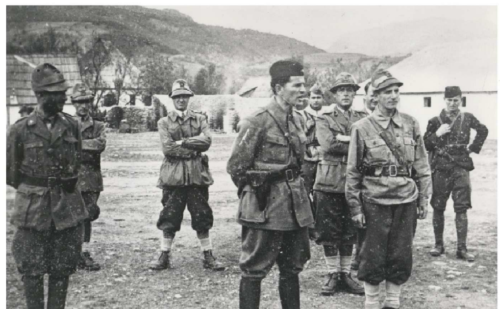
PIERO DAPCEVIC COMANDANTE DEL 1. CORPO D'ASSALTO PARIA AI COMBATTENTI DELLA DIVISIONE «GARIBALDI» A DERANE - DICEMBRE 1943.