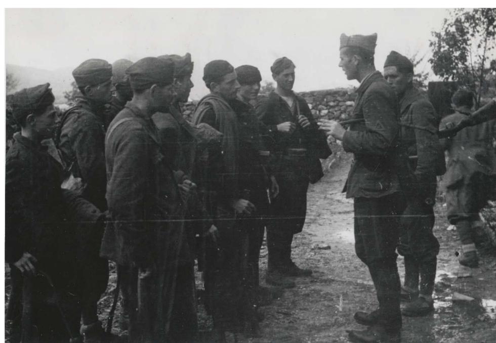
GLI ANTIFASCISTI ITALIANI SI ARRUOLANO NELLE UNITÀ DELL'ESERCITO POPOLARE DI LIBERAZIONE DELLA JUGOSLAVIA - METÀ SETTEMBRE 1943.

"Casa della Memoria" - via G. Ghislandi, 8 - Darfo B.T.