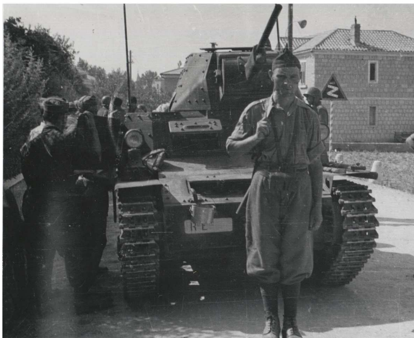
PARTIGIANI ITALIANI A SOLIN AVANZANO VERSO KLIS, CAPOSALDO TEDESCO 14. SETTEMBRE 1943.