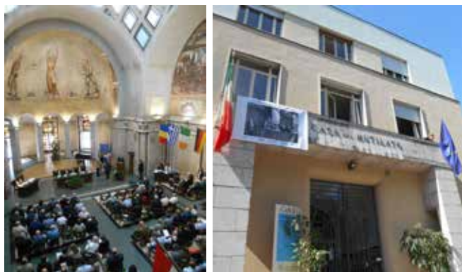
A SINISTRA L'ASSEMBLEA CONGRESSUALE 2016 PRESSO LA CASA MADRE ANMIG DI ROMA. A DESTRA LA CASA DEL MUTILATO DI MODENA CON LA GIGANTOGRAFIA DI GINA BORELLINI, "MADRE DELLA RES PUBLICA".

sostegno della Presidenza Nazionale, e l'allestimento presso il Palazzo Ducale di Modena, con l'indispensabile e fattiva collaborazione dell'Accademia Militare, di una importante mostra fotografica sulla prima guerra mondiale, con lo straordinario materiale iconografico disponibile e già organizzato dal Centro studi Carlo Balelli di Macerata.